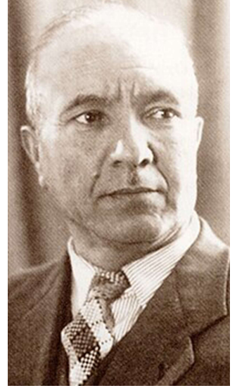
Cəlal Paşayevin xatirəsi daim qəlblərdə yaşayacaq, ədəbiyyatımızın, ədəbiyyatşünaslığımızın əbədi mövzusu olaraq qalacaq.

XX əsrin ədəbi-elmi fikrinin korifeylərindən olan Mir Cəlal Paşayev çağdaş Azərbaycan tarixində ədəbiyyatşünas-nəzəriyyəçi alim kimi də xüsusi yer tutub. Filologiya fakültəsi tələbələrindən birinci kursda istifadə etdikləri "Ədəbiyyatşünaslığın əsasları" dərsləri sonralar da mütəxəssislərin stolüstü kitabı olub. Böyük pedaqoq 1936-cı ildən ömrünün sonunadək dərslər dediyi universitetin auditoriyala-