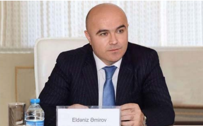
Azərbaycan Avropası enerji ilə-təmin etməkdə mühüm rola sahibdir.